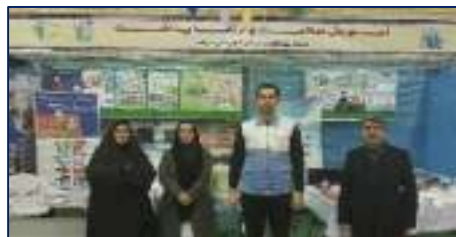
برپایی غرفه سلامت در نمایشگاه «ترتا» در شهرستان سرخه ۱۴۰۲/۱۱/۱۶