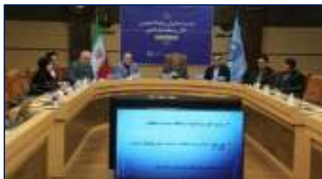
حضور مدیر روابط عمومی دانشگاه در نشست مدیران روابط عمومی دانشگاه‌های علوم پزشکی کلان منطقه یک کشور ۱۴۰۲/۱۱/۱۶