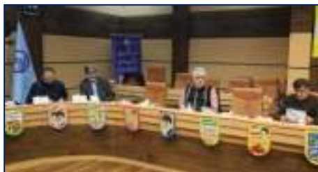
حضور رئیس دانشگاه در شورای سیاست‌گذاری کلان منطقه یک دانشگاه‌های علوم پزشکی کشور ۱۴۰۲/۱۱/۱۴