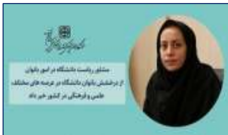
درخشش بانوان دانشگاه در عرصه های مختلف علمی و فرهنگی ۱۴۰۲/۱۱/۱۶